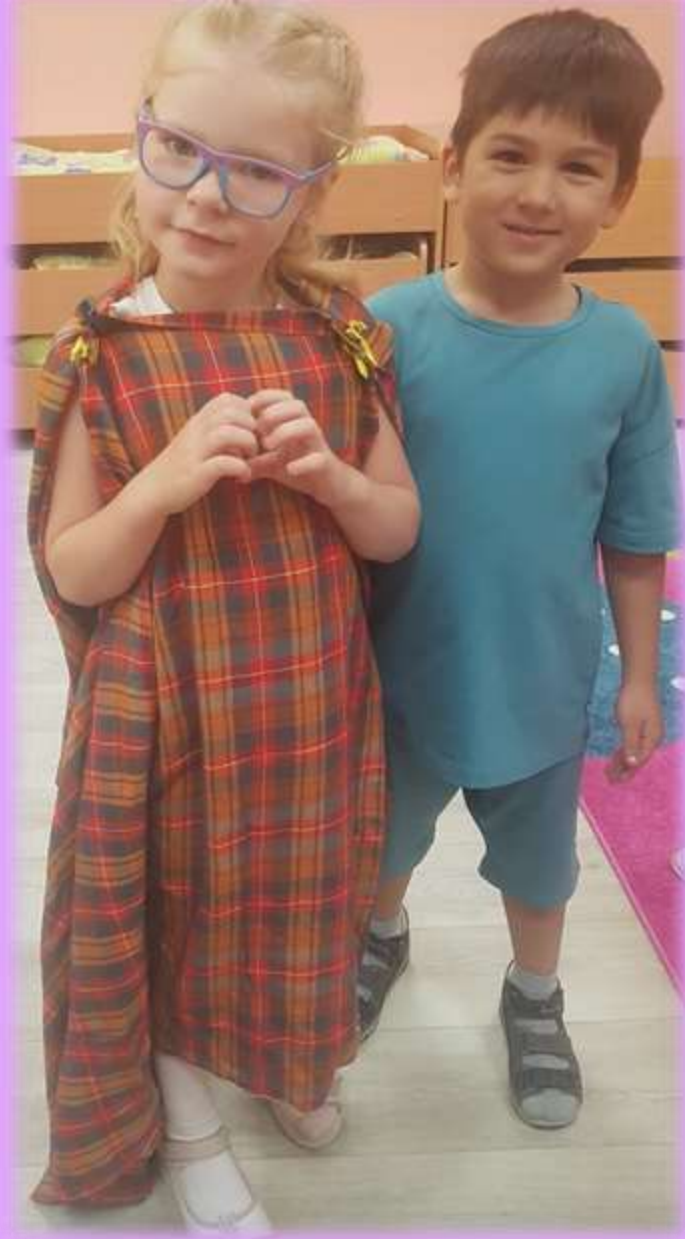
ОДЕЖДА ДРЕВНЕГРЕЧЕСКОГО ТЕАТРА, ВОССОЗДАНИЕ ОБРАЗА